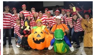
事務局賞の皆さま 衣装&ダンスで 盛り上げていただき ました!!!

こんな京都協会事務局を、今後も宜しくお願い致します! そして、「入会したいかも?」と思ったらすぐにお電話ください。 会員の皆様も、新しい仲間をぜひご紹介お待ちしております!!