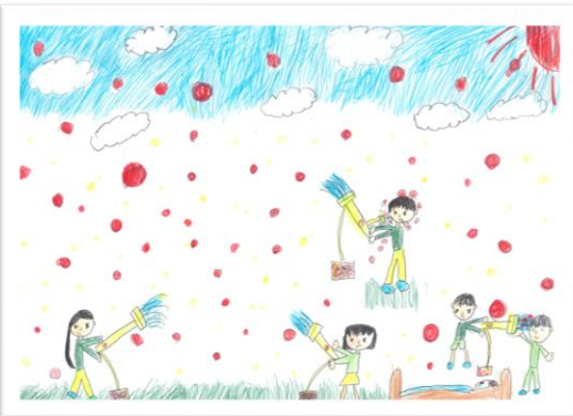
3・4年生の部【銅賞】 「見えないゴミをやっつけろ」笹川初葵（3年生） （和光建物総合管理株式会社）