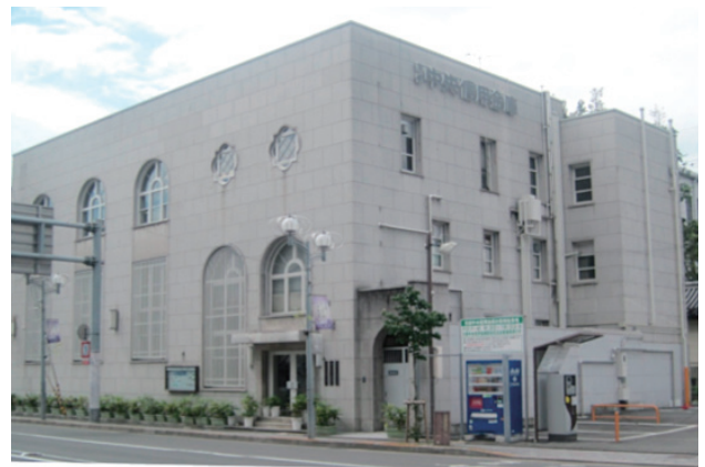
中信興産株式会社ビル 京都市下京区烏丸七条西北角

当社は、平成4年5月18日、京都中央信用金庫の関連会社として設立、以来19年間にわたり、主に京都中央信用金庫の不動産の保守・管理と清掃業務、貸しガレージ業務、不動産の鑑定評価業務、その他付属業務を行ってまいりました。平成19年3月には本社ビルの屋上緑化を実施、平成22年5月には中小企業がよりわかりやすく環境問題に取り組める規格である「KESステップ2」を取得、平成23年3月には、国際規格である「ISO14001」の認証を取得し、社員一丸となって地域への貢献・地球環境の保護に取り組むとともに、高品質・顧客満足の向上にむけて、5S(整理、整頓、清潔、清掃、躰)の徹底と、スキルアップと人財の育成に取り組んでいます。