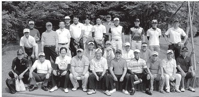
<ゴルフコンペ結果発表>

今回は、5月15日開催の総会が無事終了後での開催で、28名の参加をいただき、新緑の中天候にも恵まれ、OUT・INに分かれて、