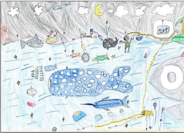
5、6年生の部【金賞】 「夜は海の大掃除」笹川 樹(5年生) (和光建物総合管理株式会社)

発行：公益社団法人京都ビルメンテナンス協会 〒612-8419 京都市伏見区竹田北三ツ杭町 45 番地 アイビービル 2A TEL 075-606-1258 FAX 075-606-1259 ホームページ http://www.kyoto-bma.or.jp/ 編集：広報委員会 委員長 山下耕平 2020年10月発行