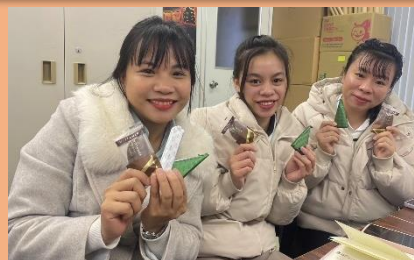
実習生が、入国後講習を終え 京都への配属時に書いた作文です