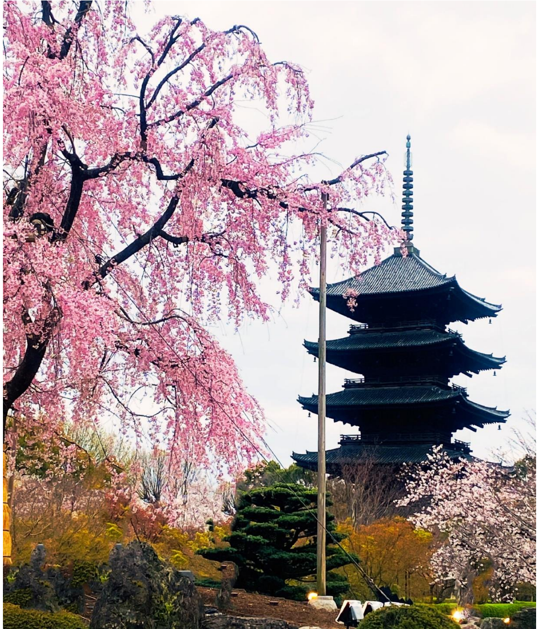
場所: 東寺(京都市南区)